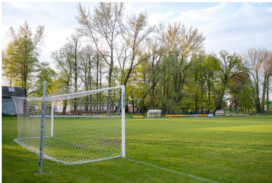
Boisko sportowe w Gruszczycach