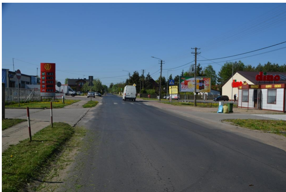
Centrum Gruszczyce – położenie przy drodze powiatowej nr 1709

Najbliższa stacja kolejowa znajduje się w odległości ok. 10 km od wsi. Przebiega tam linia kolejowa Ostrów Wielkopolski – Zduńska Wola. Gmina Błaszki posiada bardzo dobre rozwiązania komunikacyjne drogowe z obszarami zewnętrznymi. Ruch tranzytowy odbywa się głównie na drodze krajowej nr 12. Układ drogowy zapewniający podstawową obsługę ruchu lokalnego i zewnętrznego stanowią także dwie drogi wojewódzkie nr 710 i 449 oraz sieć dróg powiatowych. Stan techniczny tych dróg jest zadowalający a powiązania komunikacyjne realizują potrzeby mieszkańców.