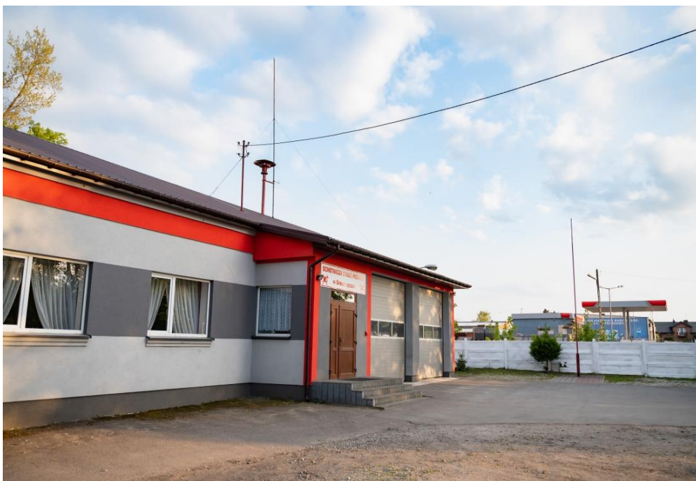
Budynek Ochotniczej Straży Pożarnej w Gruszczycach

Uzupełnieniem działań KGW i OSP jest działalność sportowa Towarzystwa Sportowego Gruszczycy. Ludowy Zespół Sportowy powstał w roku 1975, a od grudnia 1998 przyjął nazwę Towarzystwa Sportowego Gruszczycy. Obecnie w drużynie seniorów trenuje 30 zawodników, a w dwóch grupach juniorskich rocznik 2009-2012 - 30 osób, 2013 i młodsi - 25 zawodników. Celem TS Gruszczycy jest zachęcanie do aktywnego trybu życia i rozpowszechnianie gry w piłkę nożną w regionie.