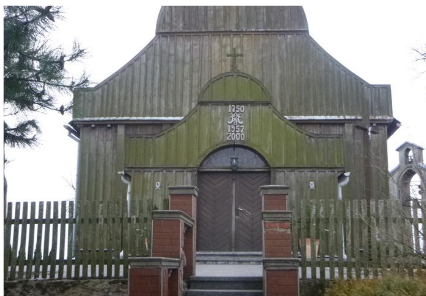
Kościół parafialny pw. św. Stanisława, drewniany, 1790, nr rej.: 813 z 28.12.1967 oraz 17/A z 31.08.1994