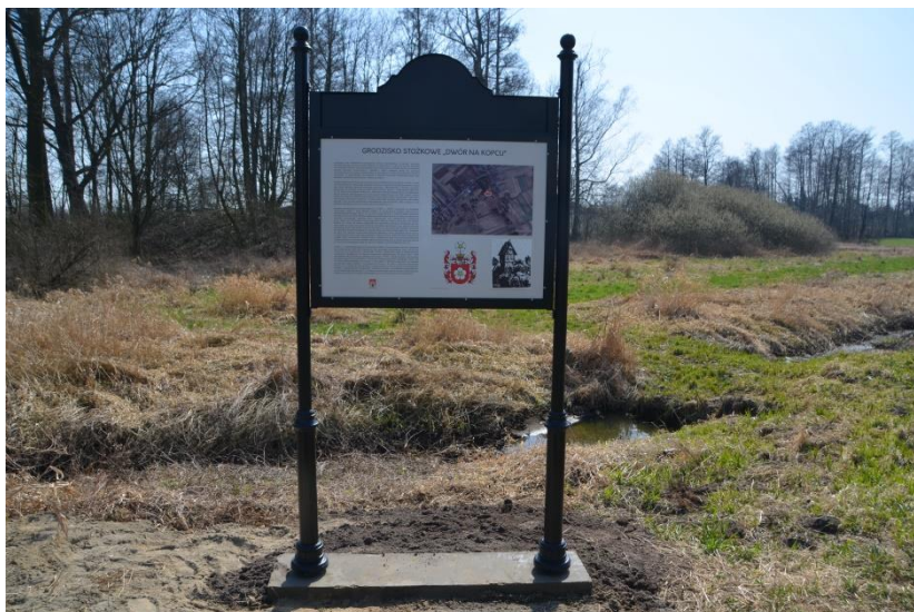
Grodzisko stożkowe „Dwór na kopcu”