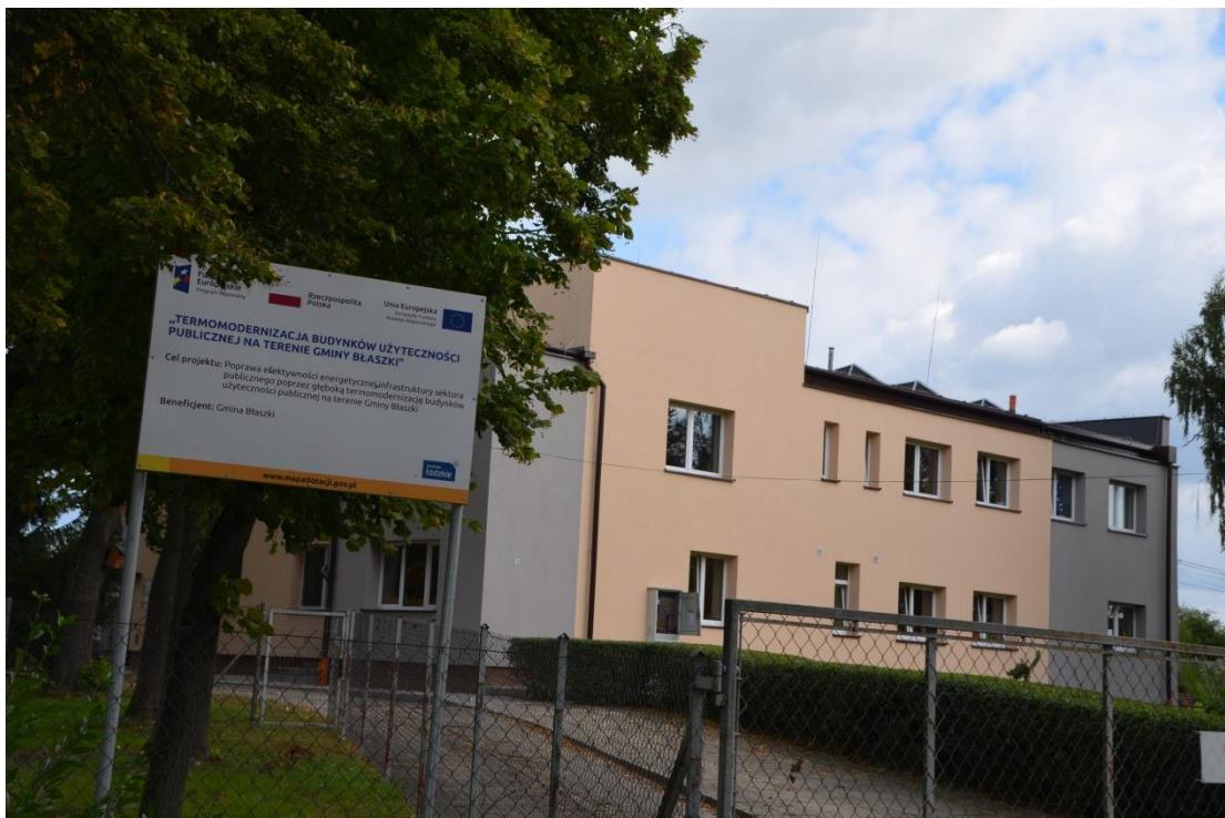
Budynek Przedszkola Samorządowego w Gruszczycach