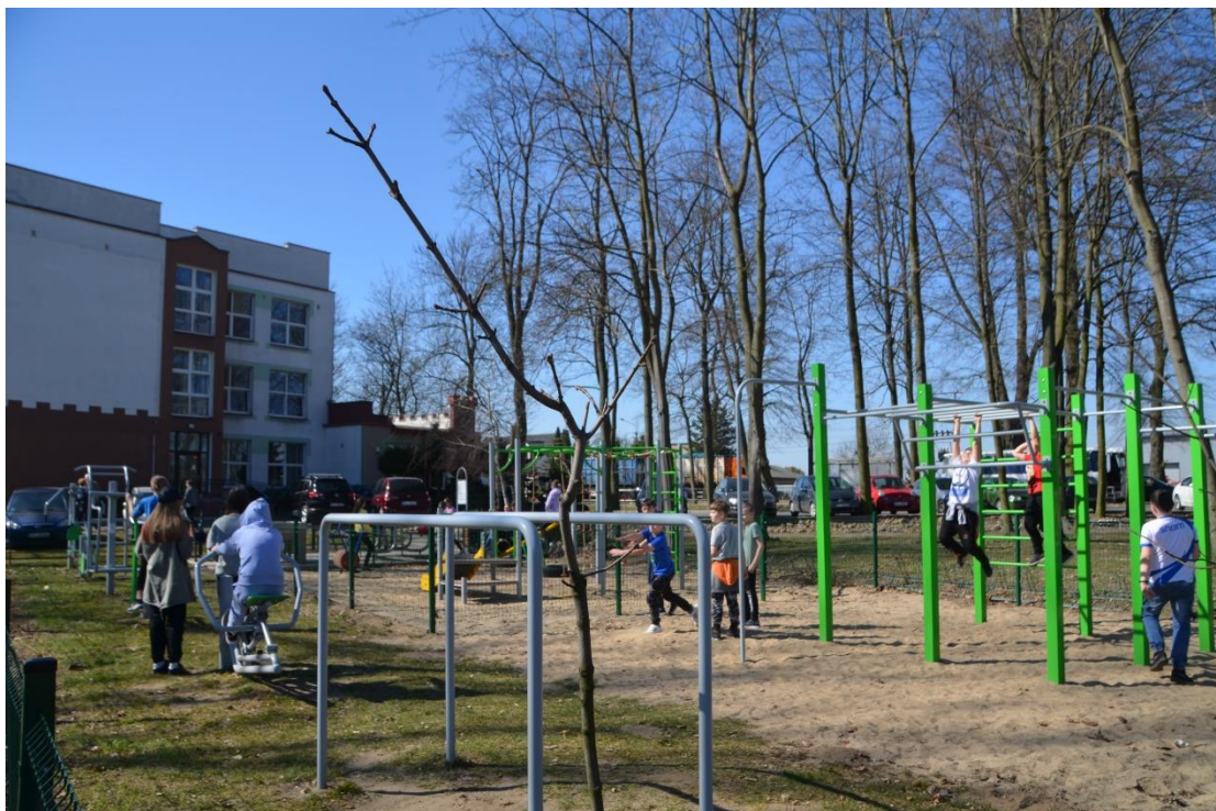
Otwarta Strefa Aktywności w Gruszczykach