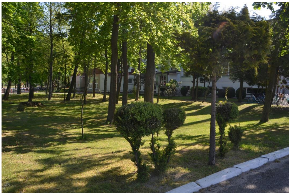
Park przy Szkole Podstawowej w Gruszczykach