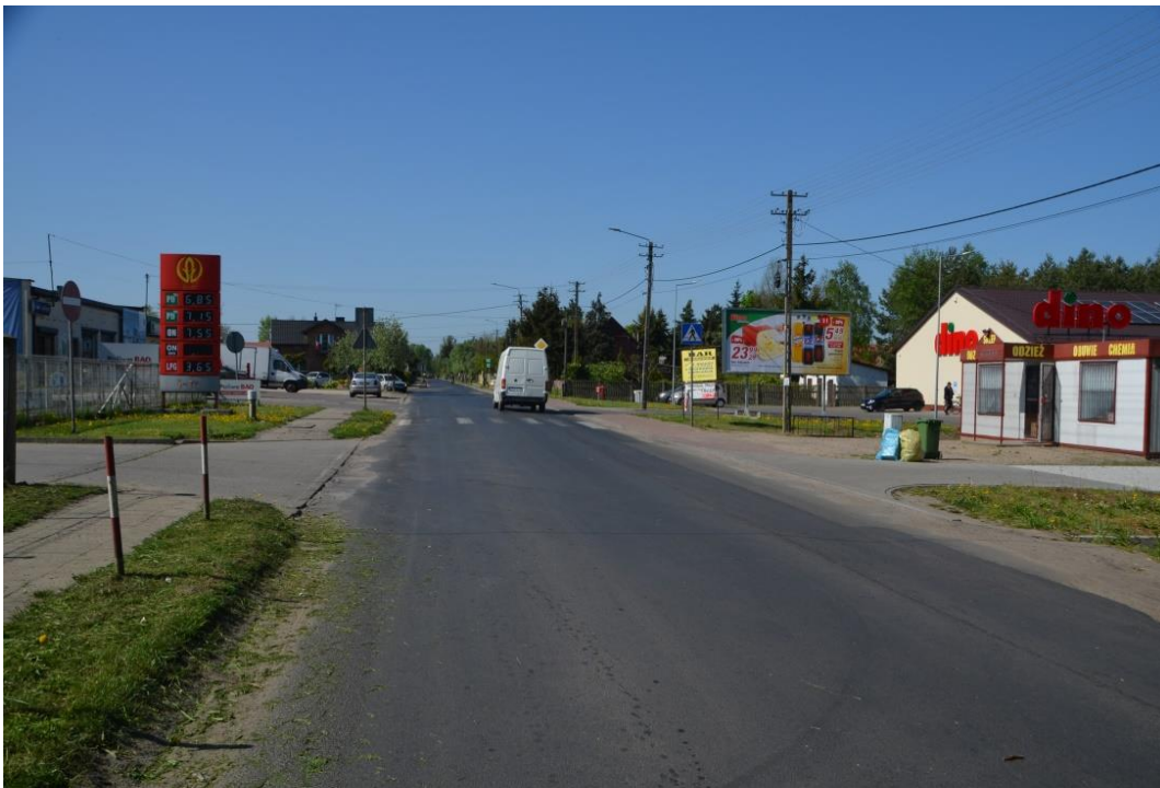
Centrum miejscowości

Wieś Gruszczyce z uwagi na swoje położenie jest wsią atrakcyjną zarówno dla turystów jak i mieszkańców. Obszarem o szczególnym znaczeniu dla zaspokojenia potrzeb mieszkańców jest teren znajdujący się w centrum wsi, gdzie znajduje się strażnica OSP, siedziba KGW, zabytkowy kościół, Szkoła Podstawowa oraz Przedszkole Samorządowe a także boisko sportowe i Otwarta Strefa Aktywności. Wzdłuż głównej drogi przebiegającej przez ścisłe centrum wsi położone są również najważniejsze punkty handlowe i usługowe. Na tym obszarze skupia się życie społeczne i codzienna aktywność mieszkańców Gruszczyk.